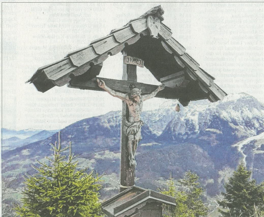
Am Grünstein hat man eine herrliche Aussicht.

Los geht die Tour in Prien am Chiemsee, das Ziel ist das österreichische Obertraun – und na-